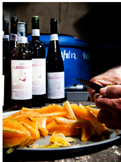
Figura 2. Tradición en la elaboración de vinos, Municipio Cabaiguán, Provincia Sancti Spíritus, Fotografía: Alain López.