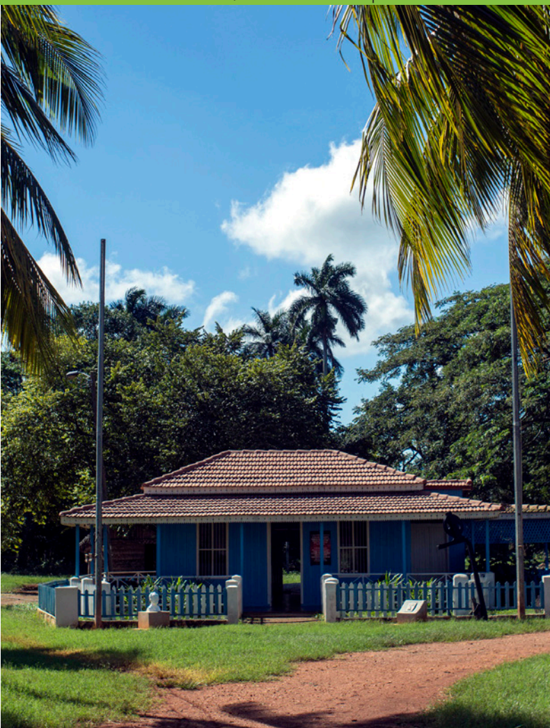
Finca Santa Elena. Municipio Nueva Paz, Provincia Mayabeque.