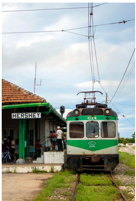
Figura 4. (Derecha) Tren de Hershey, Municipio Santa Cruz del Norte, Provincia Mayabeque.