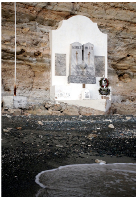
Figura 3. (Izquierda) Monumento sitio de desembarco de Martí y Gómez en Playita de Cajobabo, Municipio Imías, Provincia Guantánamo.

Para implementar lo anterior, el municipio se apoyará en la utilización de instrumentos específicos para generar la valorización local del patrimonio cultural que han sido aplicados con anterioridad a nivel internacional y que permiten transitar por momentos claves de este proceso, dígame: identificación, asignación del valor, y puesta en valor. Entre estos instrumentos se encuentran la elaboración de registros, atlas, inventarios, catálogos, programas, estudios de detalles, plan de manejos, proyectos e iniciativas municipales, planificación interpretativa, e itinerarios culturales, entre otros.