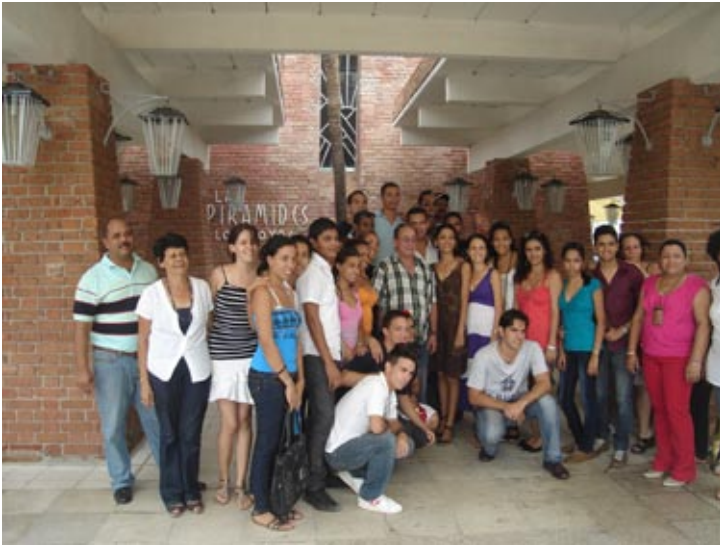
Figura 15: Visita a una obra rehabilitada: La cafetería Las Pirámides en ocasión de la jornada de restauración de 2013.

investigación. Por los resultados obtenidos, la Asociación de Estudiantes en Defensa del Patrimonio de la carrera de Arquitectura, ostenta la categoría de Mejor grupo científico estudiantil de la Universidad de Oriente en el curso 2011-2012.