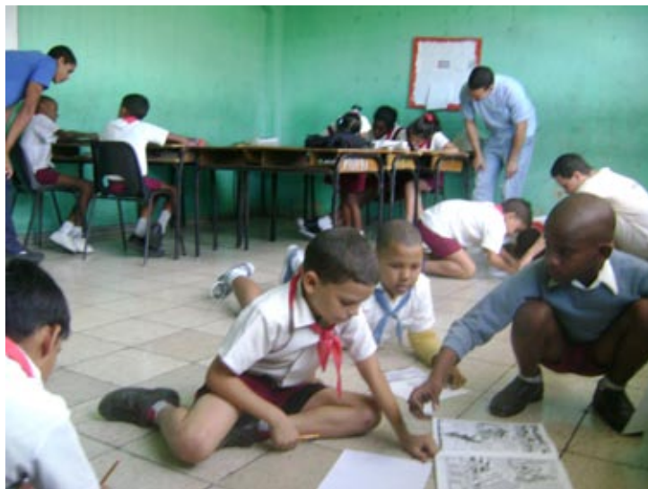
Figura 12: Estudiantes de la AEDP en su labor extensionista en las escuelas primarias. 2012.

El trabajo científico del grupo se organiza bajo la tutela de los docentes que forman parte de la línea de