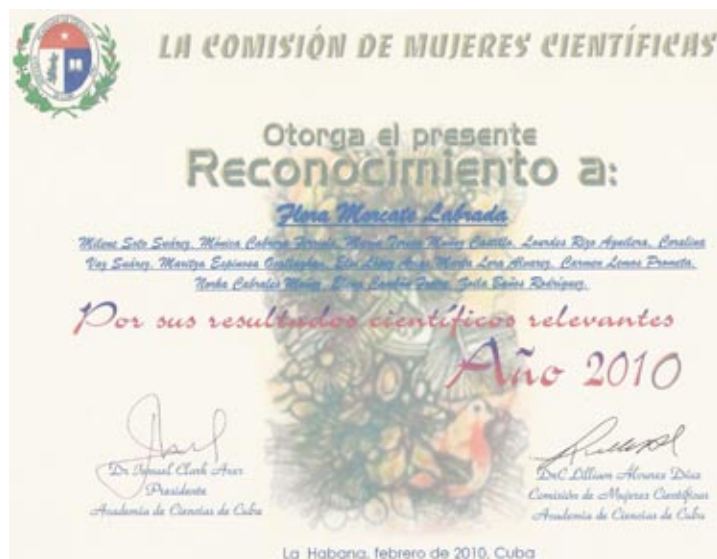
Figura 10: Premio de la ACC a las mujeres científicas, 2010.