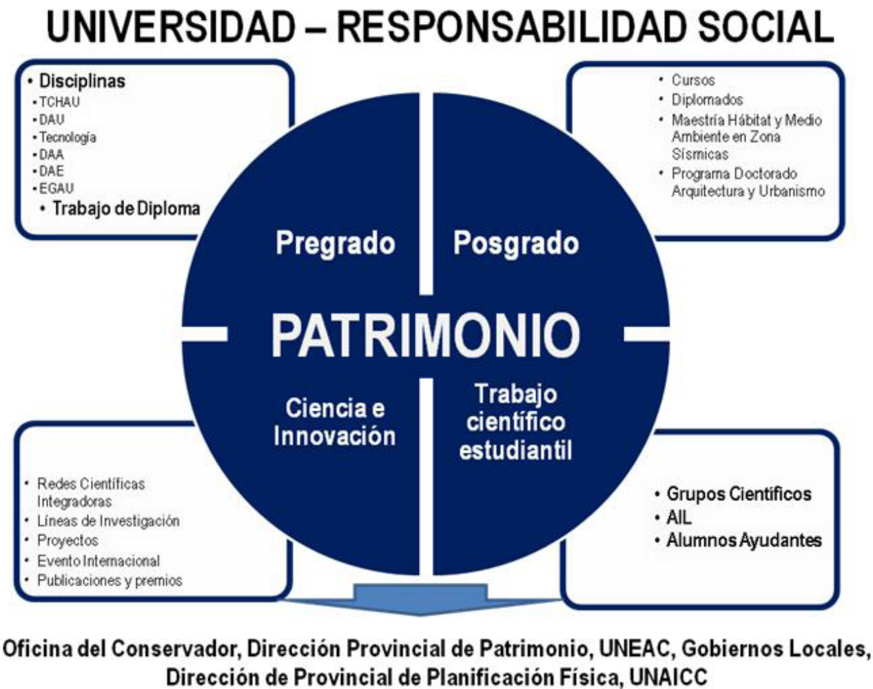
Figura 1: Esquema del proceso de gestión de la carrera de Arquitectura de la Universidad de Oriente para potenciar la salvaguarda del patrimonio edificado. Elaborado por las autoras.

Desde esta óptica, en la actualidad, la actividad universitaria a favor de la conservación del patrimonio posee en la carrera de Arquitectura muchas facetas interrelacionadas: la formación curricular de pregrado, posgrado, académica y científica, la ciencia e innovación unida a la actividad científica estudiantil, que engloban las provincias de Santiago de Cuba, Granma y Guantánamo (figura 1).