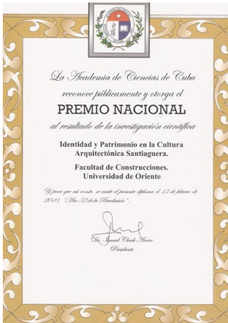
Figura 9: Premio Nacional de la ACC al resultado científico: Identidad y patrimonio en la cultura arquitectónica santiaguera, 2009.

• Identidad y patrimonio en la cultura arquitectónica de Santiago de Cuba. Colectivo de autores. Premio Academia de Ciencias de Cuba, 2009 (figura 9).