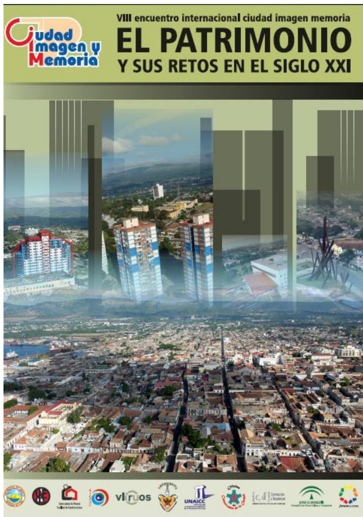
Figura 8: Cartel del VIII Encuentro Internacional, Ciudad, Imagen y Memoria, 2013.

Muestra de este quehacer se refleja también en la realización del evento Santiago de Cuba: Una visión crítica de su ciudad y su arquitectura, que tuvo su génesis en la Comisión Cultura, Ciudad y Arquitectura de la UNEAC, a la que pertenecen varios investigadores de la Facultad de Construcciones, la participación creciente en eventos internacionales y nacionales, de profesores y estudiantes, así como la celebración de jornadas de restauración y rehabilitación del patrimonio construido que se realiza anualmente en vinculación con la Oficina del Conservador de la Ciudad de Santiago de Cuba.