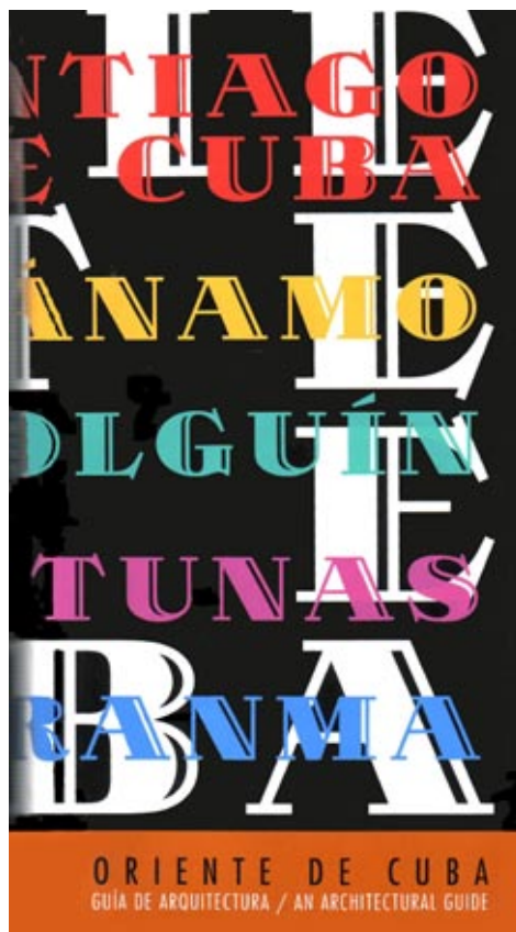
Figura 7: Portada del libro Oriente de Cuba. Guía de Arquitectura , 2002.