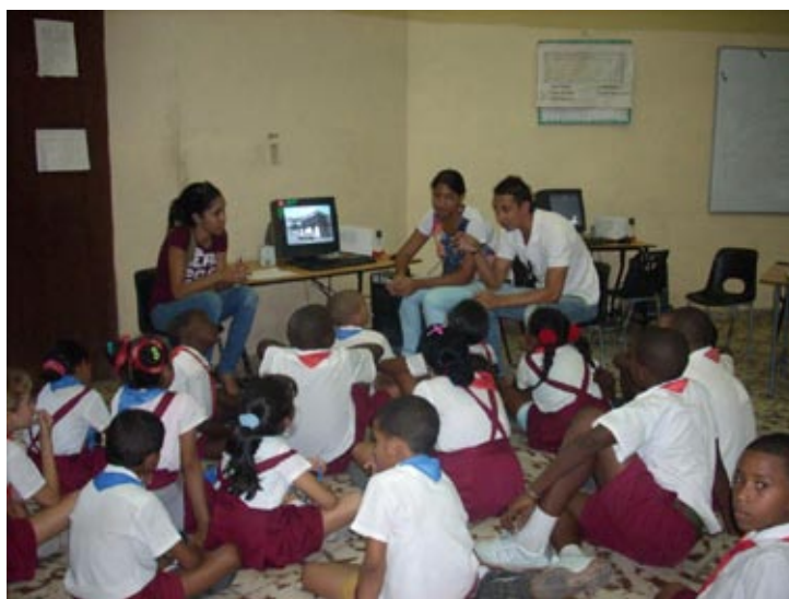
Figura 13: Estudiantes de la AEDP en su labor extensionista en las escuelas primarias. 2012.