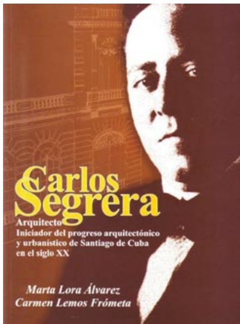
Figura 6: Portada del libro: Carlos Segrera. Arquitecto iniciador del progreso arquitectónico y urbanístico de Santiago de Cuba , 2012.