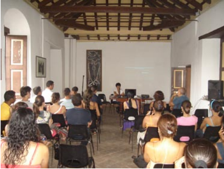
Figura 14: Conferencia en la Oficina del Conservador de la Ciudad de Santiago de Cuba dirigida a los estudiantes de la AEDP en la jornada de restauración de 2013.