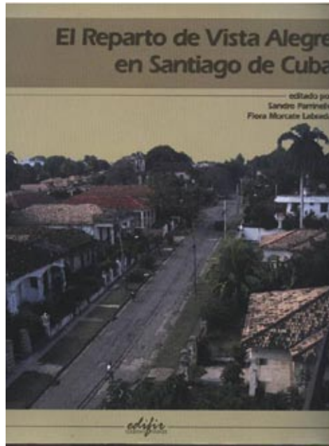
Figura 5: Portada del libro: El reparto Vista Alegre en Santiago de Cuba , 2008.