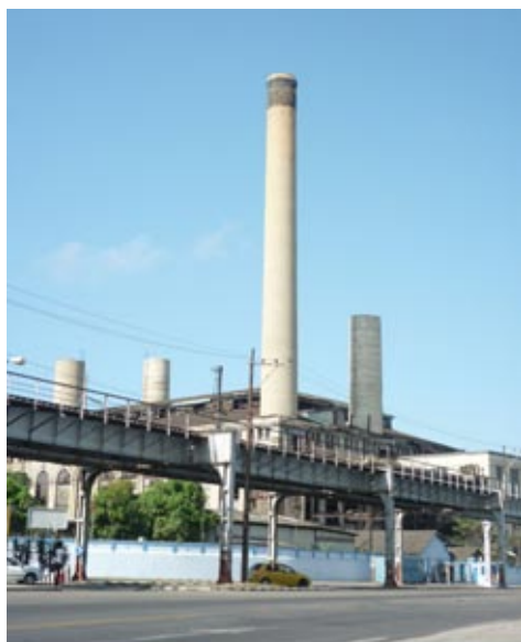
Figura 1: Antigua termoeléctrica de Tallapiedra.

Estudios recientes sobre el papel que juegan los bienes culturales dentro del desarrollo de los territorios han demostrando entre otros, los valores estéticos, cognitivos, identitarios, económicos y simbólicos, que otorgan los mismos a la localidad donde se ubican [7]. Los museos de arte contemporáneo, debido a su escala, su potencial como entes dinamizadores, sus posibilidades para propiciar el intercambio con la comunidad y debido también al impacto visual y económico que pueden tener dentro de la ciudad, conforman parte de esos hitos urbanos identificables por la población, los cuales favorecen la rehabilitación y el desarrollo de los territorios donde se ubican [8]. Este efecto impulsor urbano ha sido reconocido como "efecto Guggenheim", atendiendo al impacto ocasionado por la inserción de la sede de dicho museo en Bilbao [9] (figura 5, 6 y 7).