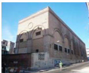
Figura 2: Antigua planta eléctrica de Colón.