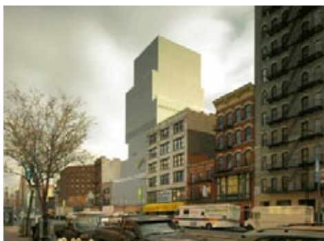
Figura 7: Museo de Arte Contemporáneo de Nueva York.

Es notorio que Cuba y específicamente, La Habana, como centro cultural más importante del país, no cuente con un museo de arte contemporáneo, a pesar del reconocimiento internacional de su producción artística, la cual no tiene ya cabida en los recintos existentes para conservar y exhibir tanpreciado patrimonio [10][11][12]. Un conflicto de tal magnitud justifica la apremiante necesidad de estudios a escala de ciudad que permitan adelantar alternativas para el posible emplazamiento de una instalación de este tipo.