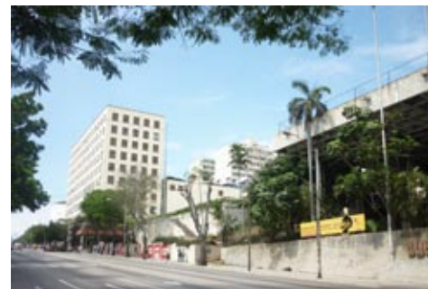
Figura 17: Terreno potencial en La Rampa en lo que fuera el lote del edificio Alaska.

Según se pudo comprobar, los principales espacios de posible inserción están constituidos por terrenos vacíos, así como algunos talleres y parqueos