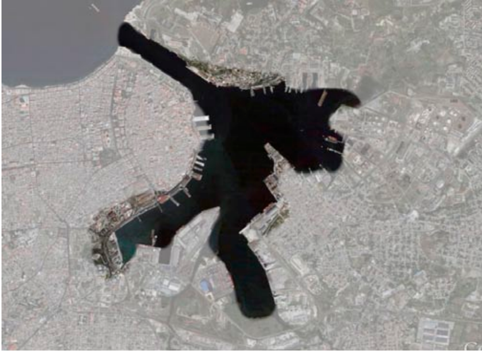
Figura 9: Vista satelital de la zona de la bahía de La Habana.

Los resultados preliminares obtenidos por tales estudios recomiendan el reforzamiento de las funciones sociales, culturales y recreativas en la franja oeste de la bahía (desde la plaza de San Francisco hasta el área oeste de la ensenada de Atarés); la zona costera de Regla y el área sur de Casablanca. Dada la diversidad en la conformación urbana del borde costero de la bahía, para la realización de este estudio se analizaron de manera independiente cada una de estas tres franjas costeras (figura 9).