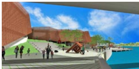
Figura 4: Paseo de Las Esculturas. Áreas exteriores de la propuesta del Museo de Arte Contemporáneo en la ribera del río Almendares. Autor Arq. Natalí Collado.