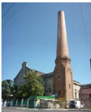
Figura 3: Antigua fábrica de aceite El Cocinero.