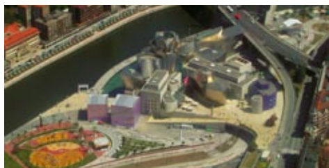
Figura 6: Museo Guggenheim de Bilbao.