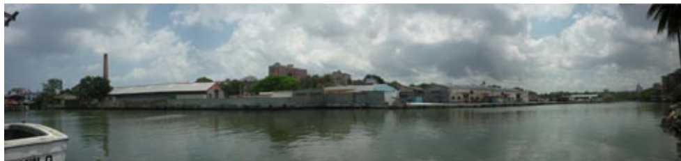
Figura 20: Ribera del río Almendares. Antiguos astilleros Chullima.

verde por lo que disminuye notablemente la disposición de áreas a utilizar las cuales tienen entre 6 000 y 48 000 m 2 (figuras 20 y 21).