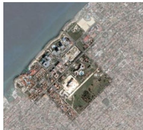
Figura 22: Vista satelital de Montebarrreto.

El diseño urbano se aprecia como incompleto, aunque la morfología urbana dispersa favorece las condiciones ambientales del territorio. La zona tiene