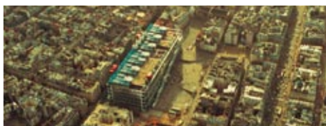
Figura 5: Centro de Arte y Cultura George Pompidou.