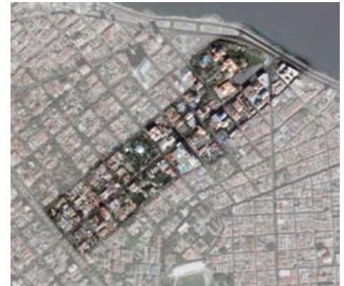
Figura 16: Vista satelital de La Rampa

25. DIRECCIÓN PROVINCIAL PLANIFICACIÓN FÍSICA LA HABANA. Regulaciones urbanísticas Ciudad de La Habana. El Vedado. Municipio Plaza de la Revolución. Madrid: Ediciones Boloña; La Habana: Ediciones Unión, 2007.