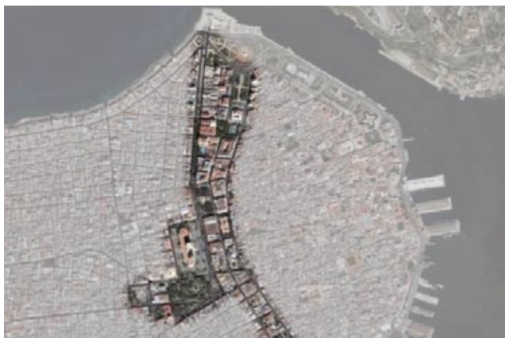
Figura 14: Vista satelital de la zona de Las Murallas.

Esta zona conforma el límite histórico entre la antigua ciudad intramuros y todo su desarrollo oeste, por lo cual es prácticamente accesible al resto de la ciudad. Las vías principales que la definen (Prado, Zulueta y Monserrate con sus diferentes denominaciones) constituyen verdaderos ejes colectores y pueden considerarse como importantes núcleos de confluencia, aunque algunos puntos de interés, como el Parque de la Fraternidad y la Estación Central de Ferrocarriles, aun no cuentan con una solución urbana satisfactoria (figura 14).