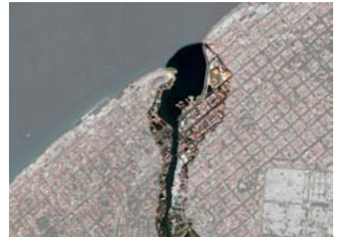
Figura 19: Vista satelital de la desembocadura del río Almendares.

Existe una gran potencialidad de refuncionalizar las márgenes del río donde hoy se encuentran servicios, principalmente industriales y administrativos que impiden comunicar la población con la ribera. Sin embargo, gran parte de esta zona está dedicada en el futuro a recuperar la franja de protección