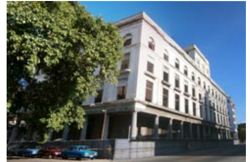
Figura 15: Antigua fábrica de tabaco La Corona.

Los principales terrenos libres de esta área son furrnias sin construir, zona subutilizadas como parques y algunos edificios antiguamente comerciales.