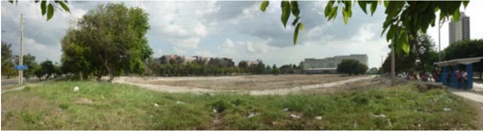
Figura 23: Lote esquina entre 3ra y 60 en Montebarrreto.

En la actualidad se identifican con potencialidad cinco terrenos vacíos que poseen entre 4 500 y 17 000 m 2 (figura 23).