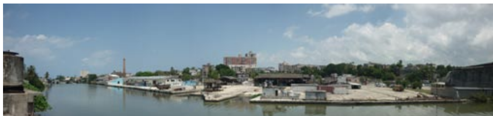
Figura 21: Ribera del río Almendares. Antiguos astilleros Chullima.

En los últimos años ha surgido un interés de ubicar centros de acción cultural-comunitaria en la región como la Casa de las Tejas Verdes y el muy reciente proyecto de fábrica de arte de X Alfonso ubicado en la antigua fábrica de aceite El Cocinero (de posible recién inauguración). Aunque no se encuentran muy cercanos a la zona analizada, la calle Línea conecta varios teatros de importancia en la ciudad.