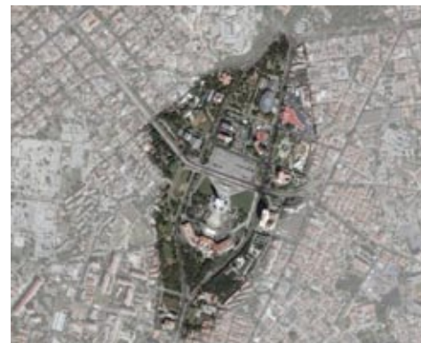
Figura 18: Vista satelital de los alrededores de la Plaza de La Revolución.