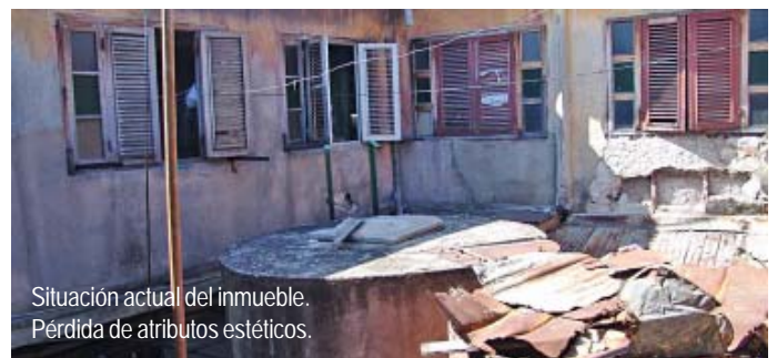
Situación actual del inmueble. Pérdida de atributos estéticos.