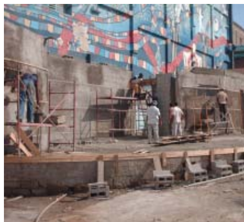
Trabajos en la construcción de la Plaza Cultural.