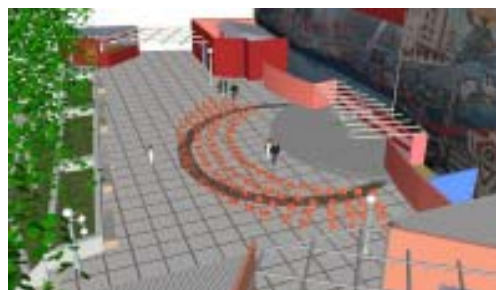
Propuesta Plaza Cultural Aguilera.

para el abastecimiento de agua del bar que se encuentra soterrado debajo de la plaza, el cual perteneció al antiguo cine-teatro (Aguilera) y un local para almacenar sillas y equipos de audio.