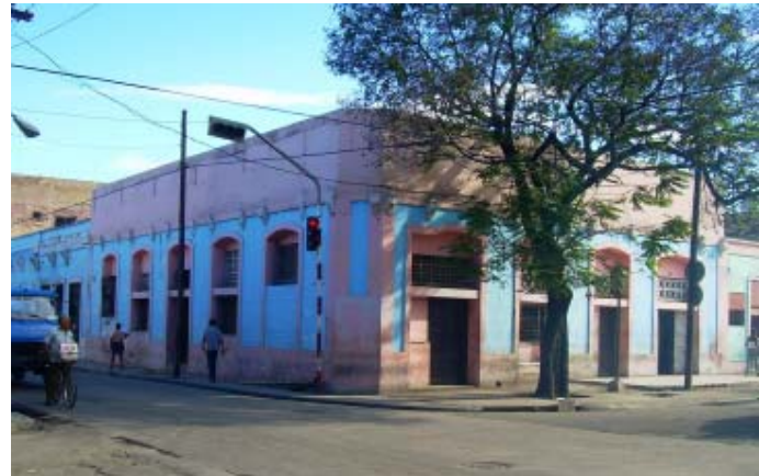
Aspecto exterior del inmueble.