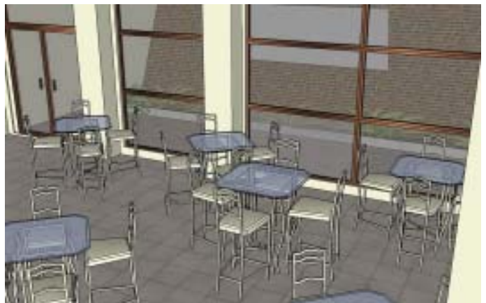
Diseño de interiores: propuesta de mobiliario.