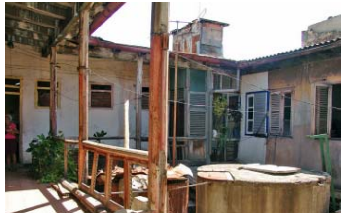
Situación actual del inmueble. Pérdida de atributos estéticos.