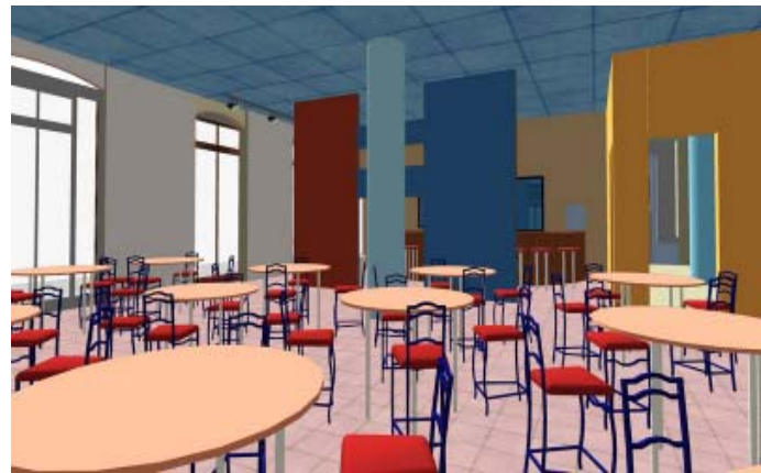
Diseño de interiores, área de salón.