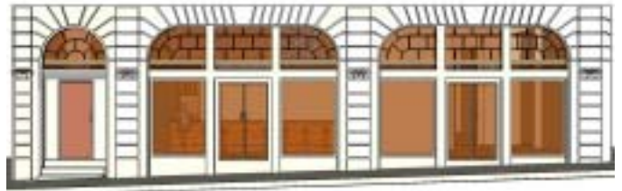
Propuesta de rehabilitación de la fachada.