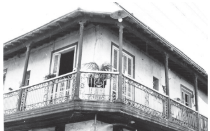
Foto de época de la esquina de Heredia y San Félix.