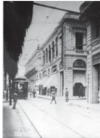
Foto de época del edificio situado en Enramadas esquina San Félix.

A partir del mes de octubre del año 2006, se asignaron varias obras, con diferentes características y grados de complejidad. En mi caso, se me asignó el diseño de un bar-restaurant para la venta de bebidas y variedades de salchichas y embutidos. El inmueble, ubicado en Enramadas No. 352- 354 esquina San Félix destinado para la función antes mencionada, cuenta con una particularidad muy especial, ya que el fondo de la edificación colinda con los restos de una antigua fortificación del siglo XVIII, conocida como el Castillo de San Francisco, la cual presenta características únicas en todo el territorio nacional (alero de sardinel de cinco hiladas), conservando uno de los cuatro baluartes de dicho castillo, por lo cual se ha decidido nombrarlo bar-restaurant "El Baluarte". El diseño propuesto contará con área de estar, barra, área de mesas, baños públicos y de empleados, closet eléctrico y de limpieza, almacén de desperdicios, almacén de víveres, oficina de administración, área de elaboración de alimentos (cocina)