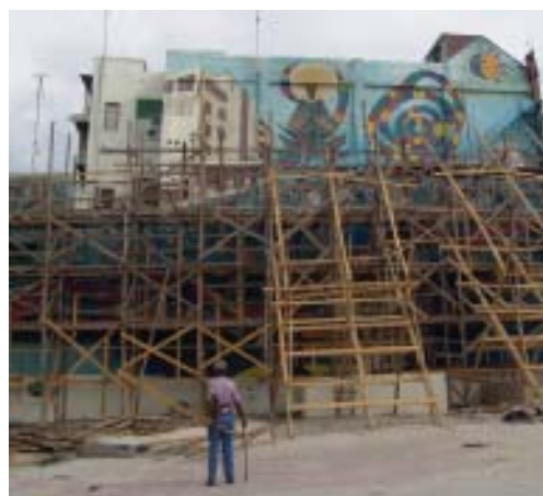
Trabajos en la recuperación de este importante espacio.

Para la propuesta de esta se dividió en tres partes; primero: la recuperación de una imagen para la ciudad con la intervención de varios artistas plásticos donde se realizó un mural pintoresco, después la apertura del bar que perteneció al antiguo cine-teatro (Aguilera) y por último la Plaza Cultural (Aguilera), la cual está destinada a actividades de índole cultural, tales como: teatro callejero, peñas trovadorescas, exposiciones, venta de artículos de artesanía, lanzamientos de libros entre otras. Por ello consta de un pequeño escenario, dos camerinos, una oficina administrativa, un local para venta de confiterías, un local