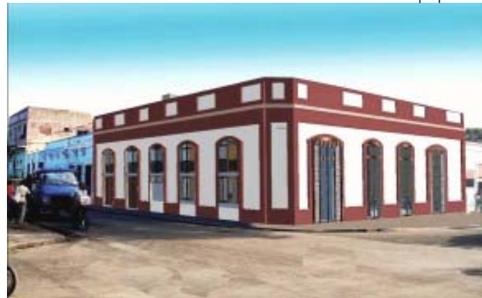
Inserción de propuesta.