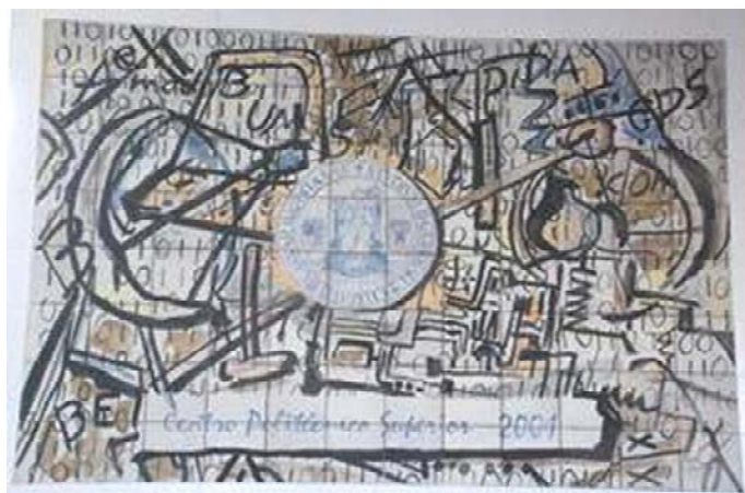
Mural Vestíbulo principal CPS-UNIZAR.

Aún cuando se considera un primer paso en la reactivación de las relaciones bilaterales, el encuentro se puede calificar como significativamente positivo , ya que se identificaron intereses comunes y acordaron acciones no solo para la colaboración entre ambos centros, sino para el desarrollo iberoamericano en materia de Expresión Gráfica Arquitectónica y su enseñanza, con vistas a alcanzar niveles superiores de calidad en formación, que contribuyan además a una mayor visibilidad y reconocimiento internacional y a una futura acreditación internacional.