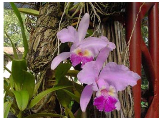
Orquideario de Soroa.