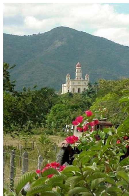
El santuario El Cobre, en Santiago de Cuba.

A pesar de sus significativos valores, el extraordinario complejo de paisajes culturales del Caribe se encuentra en permanente peligro y clama por una atención urgente a niveles nacionales e internacionales. 35 En noviembre del 2005, la Oficina Regional de Cultura de la UNESCO para América Latina y el Caribe, la Oficina de UNESCO para el Caribe y el Centro de Patrimonio Mundial de la UNESCO, celebraron en Santiago de Cuba 36 , la primera Reunión de Expertos sobre Paisajes Culturales del Caribe, que emitió la Declaración de Santiago de Cuba, 37 un primer documento caribeño sobre este tema, que podrá servir como guía para la acción en los próximos años.