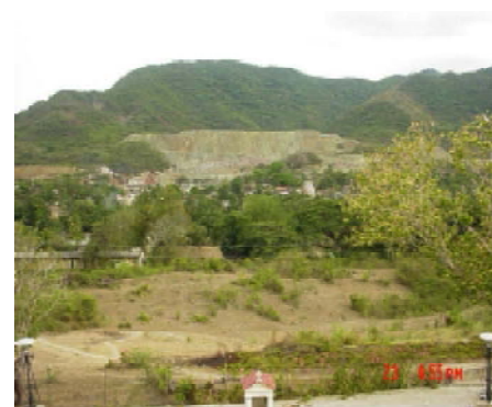
El poblado de El Cobre y el paisaje circundante visto desde el santuario.