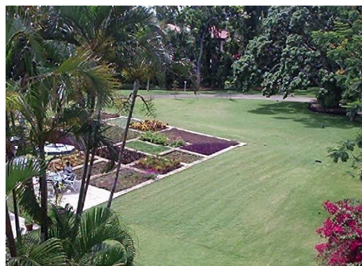
Jardines de la Casa Schultess.