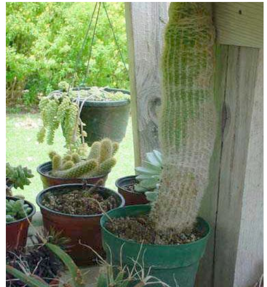
El Valle de Viñales en Pinar del Río.

Otros ejemplos cubanos son el Orquideario de Soroa en Pinar del Río, la Estación Botánica de Santiago de las Vegas, los jardines de la Casa Schultess proyectados por el famoso paisajista brasileño Ricardo Burle Marx en La Habana en los años cincuenta 8 o el Jardín Botánico Nacional de La Habana, una gigantesca obra de la década de los setenta. Descuellan también otros jardines en Guadalupe, Saint Kitts y Nevis o Dominica. Muchas viejas plantaciones también incluyen paisajes creados para el placer estético.