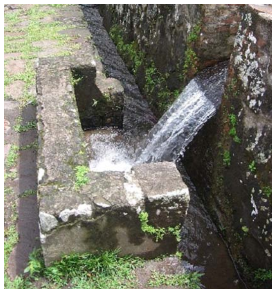
Instalación hidráulica de La Griveliere, Guadalupe.

La influencia en el paisaje fue tan grande que aún a distancia en un lugar conocido como Monterus (probablemente Mont Rouge) en Guantánamo, podemos apreciar cuando en primavera las arboledas de bucare traídos por los franceses para dar sombra a los arbustos del café, florecen en rojo, mostrando una mancha escarlata sobre la superficie verde de las montañas. Una vista muy extraña para este contexto donde la naturaleza es, generalmente, una combinación de verdes y, de vez en cuando, una nota roja o naranja ofrecida por algún flamboyán. Como si fuera un paisaje caucasiense en otoño, pero en verano y en un contexto donde las estaciones no son visibles. 20