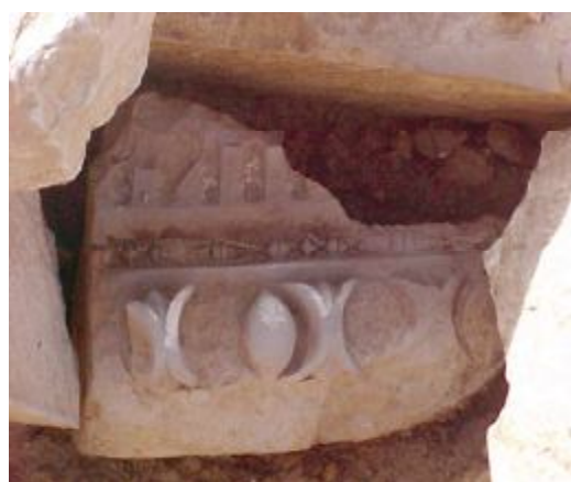
Vestigios arqueológicos en Nueva Sevilla, Jamaica.