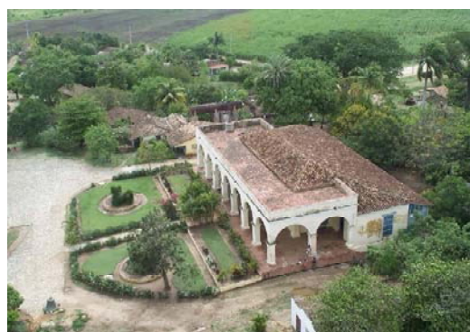
Casa del ingenio Manacas Iznaga, Trinidad.