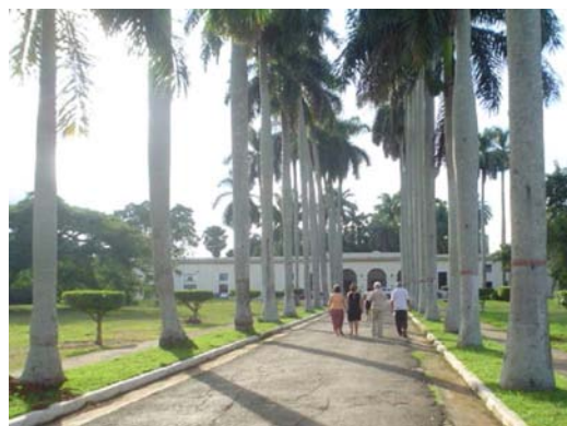
Estación Botánica de Santiago de las Vegas.

En la Martinica existen también casos relevantes, como la plantación Fond Saint Jacques, del siglo XVII, localizada entre las regiones de Sainte Marie y Marigot. Es esta una antigua propiedad de la Orden de los Dominicos, desarrollada por el sacerdote Jean Baptiste Labat. 12 En ella, la casa principal, los jardines, una capilla y un cementerio, el molino de azúcar y otros restos industriales, han sido preservados y conforman un