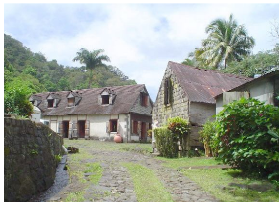
Cafetal La Griveliere, Guadalupe.

Más allá de las viejas haciendas azucareras o cafetaleras, otras entidades productivas son dignas de reconocimiento. Entre ellas, el extraordinario sistema de plantaciones de Curazao, testimonio muy importante del pasado del Caribe y de la esclavitud. En la Plantación Jan Kock, originalmente construida por la Compañía Holandesa de las Islas Occidentales para la administración de las salinas cercanas se conservan, junto con la casa de plantación, los vestigios de pasadas actividades agrícolas y de la producción salitrera.