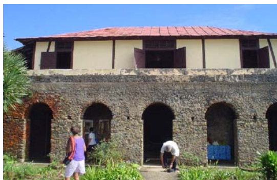
Cafetal francohaitiano, Sierra Maestra.