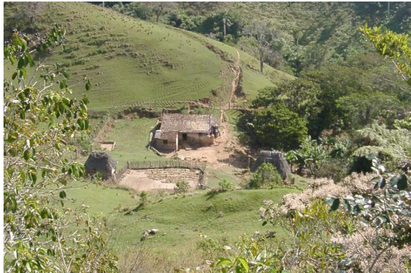
Museo Etno Histórico de Montaña, Escambray.