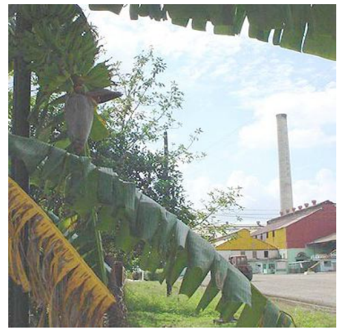
Ingenio Mal Tiempo, Cienfuegos.

Bois Cotelette fue una de las más grandes plantaciones en Dominica. Producía y procesaba caña de azúcar, cítricos, café y cacao en diferentes momentos. Su casa principal está casi intacta y se han preservado los restos del último molino de viento en esa Isla, el granero y un secadero de café, todo en medio de arboledas de frutales y exótica vegetación tropical. Las autoridades de Dominica han hecho grandes esfuerzos para salvaguardar su extraordinario patrimonio natural, pero se necesita una mayor promoción de su patrimonio arquitectónico y de sus paisajes culturales.