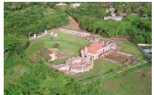
Ingenio Boca de Nigua, República Dominicana. Vista aérea.