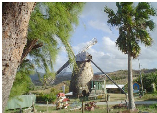
Molino Morgan Lewis, Barbados.