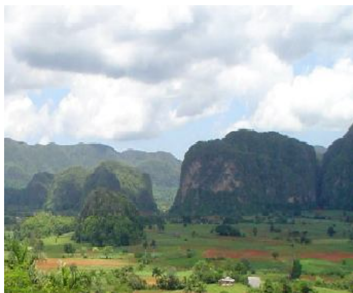
Valle de Viñales, provincia de Pinar del Río.

Al mismo tiempo han persistido manifestaciones intangibles debido a los descendientes de esclavos africanos y trabajadores procedentes de diferentes países caribeños históricamente empleados en los cortes de caña. Estos sitios se relacionan también muy fuertemente con las luchas de los obreros cubanos por sus derechos. 28 Hasta los años noventa tuvo lugar un reconocimiento progresivo de los valores culturales de los ingenios azucareros. Sin embargo, este invaluable legado se ha visto afectado por la reciente paralización de muchos de ellos como parte de una reorganización de la industria azucarera en el País. En varios de ellos desaparecieron los tradicionales campos de caña y se demolieron naves industriales que podían haberse destinado a otros usos. A pesar de esta lamentable pérdida, quedan todavía muchos ingenios que deberán cuidarse con el mayor esmero. No es exagerado afirmar que si no se toman medidas urgentes para su protección y reutilización,