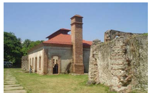
Ingenio Boca de Nigua, República Dominicana.