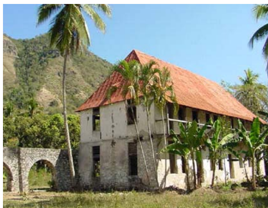
Cafetal La Isabélica, Santiago de Cuba.