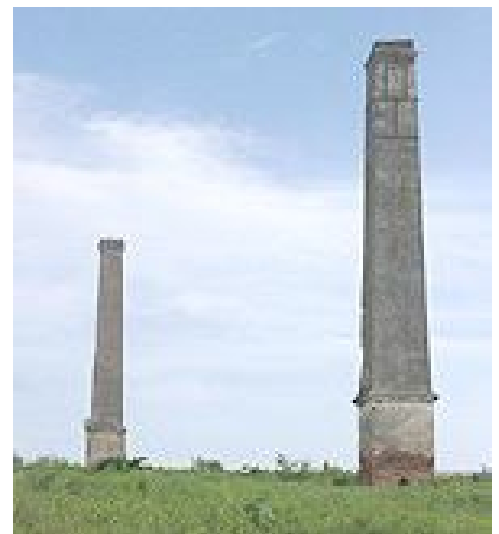
Ingenio Tartabull, Cienfuegos.