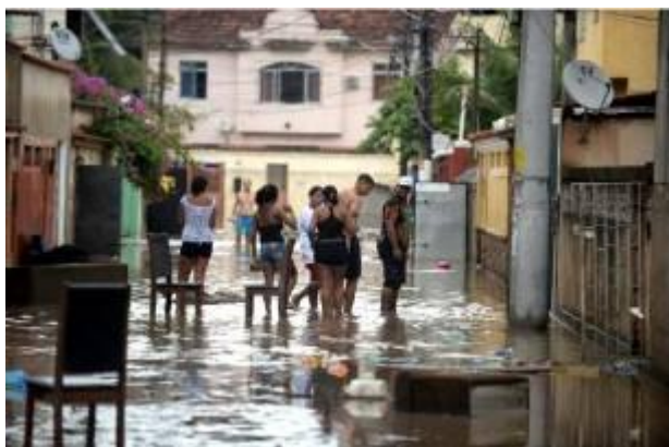
Figura 4. Inundaciones. Miércoles, 11 de diciembre, 2013 - 20h04. Rio de Janeiro. Brasil. Fuente: http://www.eluniverso.com/noticias/2013/12/11/nota/1904906/dos-muertos-fuertes-lluvias-e-inundaciones-rio-janeiro