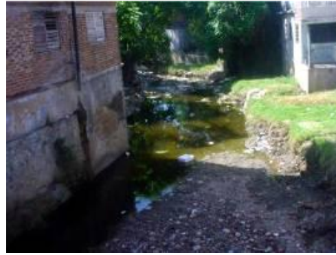
Figura 2. Viviendas en áreas del río Marañón. Ciudad de Holguín. Cuba.