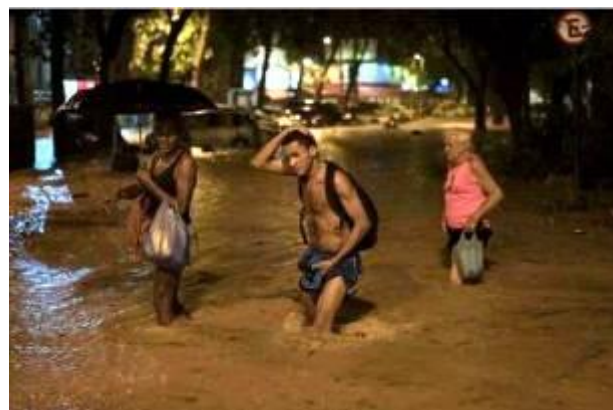
Figura 5. Inundaciones en vecindario de Gavea. Sábado, 12 de marzo, 2016. Rio de Janeiro. Brasil.

De acuerdo a la regularidad de la problemática identificada, y en función de la densidad poblacional, las condiciones del medio natural, construido y social, y las variables y atributos estudiados, se reconoció que los planes de ordenamiento urbano demandan mayores esfuerzos para adaptar sus estructuras físico-espaciales y socio políticas para robustecerlos desde un enfoque de la resiliencia en sus contextos urbanos. Estos deben perfilarse desde los límites y capacidades permisibles de sus recursos y poblaciones involucradas para concebir un ordenamiento urbano equilibrado ante los riesgos por intensas lluvias que producen inundaciones en ambas ciudades.