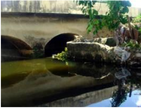
Figura 1. Puente sobre el río Marañón. Ciudad de Holguín. Cuba.