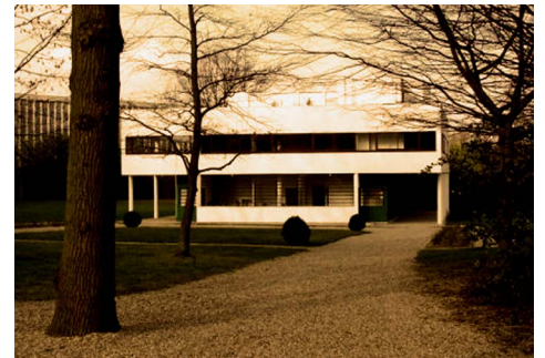
Figura 5. Villa Saboya en Poissy, construida en 1929 según proyecto original de Le Corbusier, reconocida en 1963 como monumento nacional del patrimonio arquitectónico francés y considerada paradigma de la arquitectura internacional.