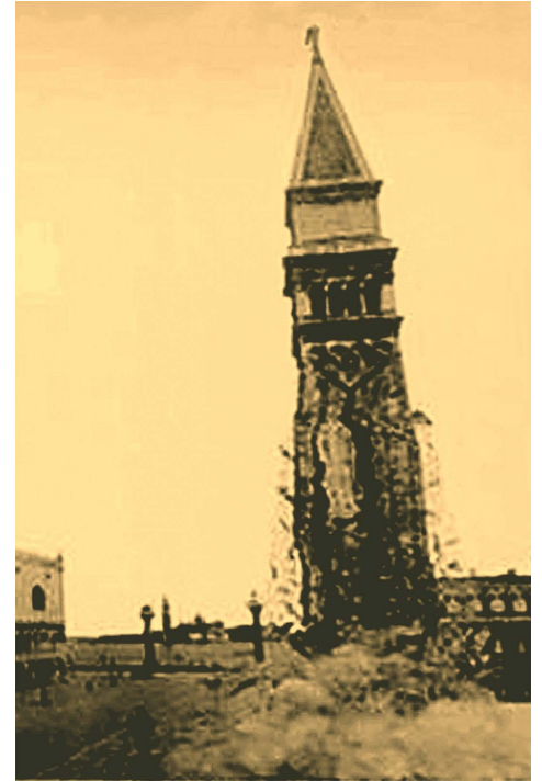
Figura 2. Imagen falsa publicada que supuestamente mostraba el momento en el que ocurrió el derrumbe del Campanil de la Plaza de San Marcos de Venecia el 2 de julio de 1902. [5].