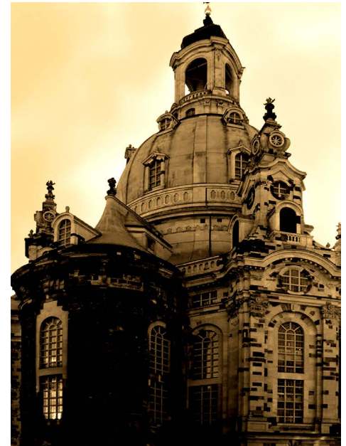
Figura 9. Reconstrucción en el siglo XXI de la antigua iglesia Frauenkirche que muestra como peculiaridad la presencia de piedras originales insertas en su estructura a manera de anastilosys. [1]

[11] González A, Horta FA. Ciencia, pedagogía y cultura científica. Revista Elementos [Internet]. 2012 [consulta: 9 de octubre de 2017];(87):[3-11 pp.]. Disponible en: http://www.elementos.buap.mx .