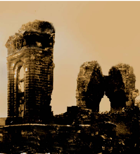
Figura 7 . Ruinas de la iglesia Frauenkirche que permanecieron como recordatorio de la barbarie del bombardeo Aliado a Dresde en la 2da Guerra Mundial, hasta la reconstrucción mimética del templo según su apariencia original en 2004.