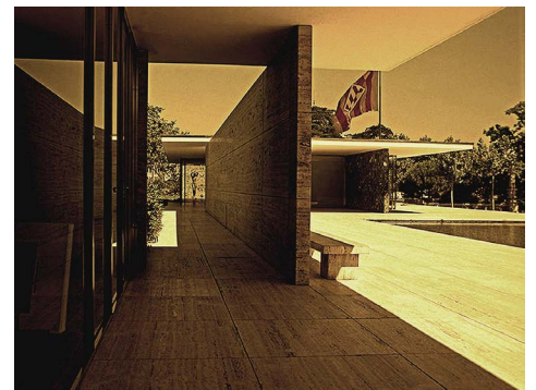
Figura 6. Réplica en el Recinto Ferial de Barcelona a finales del siglo XX, del Pabellón de Alemania en la Exposición Universal de 1929, reconstrucción que originó una intensa polémica entre posiciones teóricas contrapuestas [9].