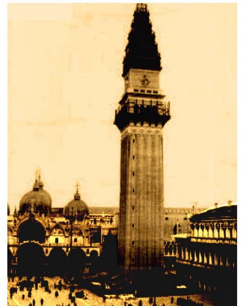
Figura 3. Reconstrucción de la réplica del Campanil de la Plaza de San Marcos según proyecto de Luca Beltrami, que mimetizaba la apariencia original que tenía antes del derrumbe ocurrido. [1].