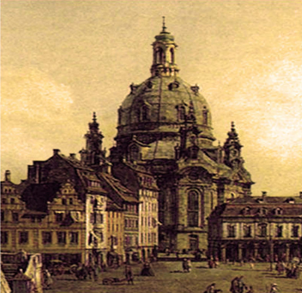
Figura 8. Un acercamiento a la imagen de la iglesia Frauenkirche en el siglo XVII, según la obra del pintor veneciano Bernardo Bellotto, también conocido como Canaletto [1].