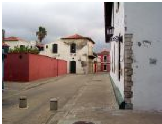
Callejón de La Jeringa, primera calle construida en la ciudad. A la derecha, fachada lateral de la Casa Guipuzcoana.

Dadas estas circunstancias, es comprensible, que el amplio acervo cultural de la nación venezolana se encuentra en muchos casos en situación de riesgo: las culturas indígenas con su patrimonio intangible; los sistemas de fortificaciones ubicados a lo largo de la costa y en el río Orinoco; las construcciones palafíticas al Occidente del país; el patrimonio industrial diseminado por la nación; la primera ciudad insular, Nueva Cádiz de Cubagua, fundada para la explotación perlífera; el Cementerio Judío de Coro, el más antiguo de su tipo en América Latina; los campos petroleros, el emblemático conjunto de viviendas multifamiliar El Silencio 5 y otro número importante de sitios que engrosaría la lista de forma alarmante.