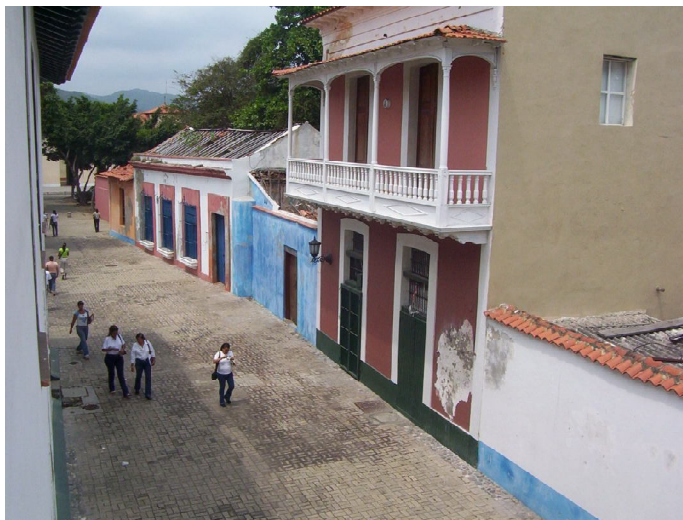
Imagen urbana. Calle

Aunque hasta el momento se han destacado las rutas de carácter transnacional que pueden inscribirse como Patrimonio de la Humanidad, el concepto ha incorporado el principio de los diversos niveles de significación del patrimonio, algunos de valor universal, otros de importancia nacional, regional o local lo que permite poner en valor aspectos e itinerarios poco atendidos hasta hoy. 11 Se conoce que el alto grado de deterioro irreversible que tiene el área histórico-patrimonial de Puerto Cabello lo sitúan actualmente en un lugar desfavorable para su posible categorización cultural o como "valor universal excepcional". No obstante, ratificando los propósitos de promover la identificación, la protección y la preservación del patrimonio cultural y natural de todo el mundo y tomando en consideración los nuevos conceptos en el propio contexto local —posición geográfica, objetivos fundamentales de la fundación de la ciudad, autenticidad de su traza urbana o la interrelación cultural que muestra en sí misma ante la mezcla de lo hispano y lo antillano—, se reconoce en Puerto Cabello una vocación especial para estar incluido en algunas de estas rutas, vislumbrando la posibilidad de profundizar en los esfuerzos en esta dirección. Sin embargo, en la literatura revisada hasta el momento no se encuentra la ciudad incluida en ninguno de los itinerarios identificados.