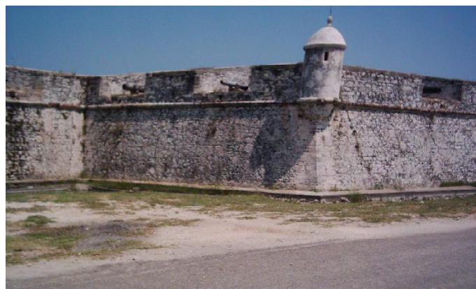
Fuerte de San Felipe de Puerto Cabello. Detalle de uno de los muros.