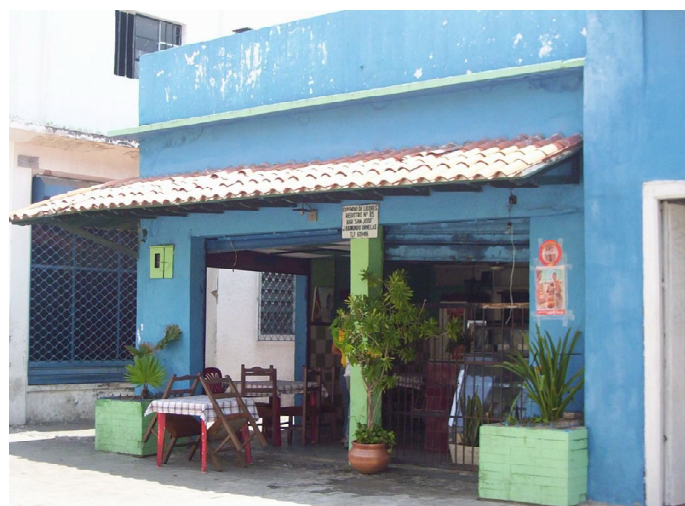
La vinculación del comercio con la vivienda es un recuso común.

Como parte del trabajo conjunto realizado por los equipos de Cuba y Venezuela dentro del Proyecto de Intercambio se elaboró la "Propuesta de Área de intervención patrimonial para la ciudad de Puerto Cabello" 12 que amplía la zona con