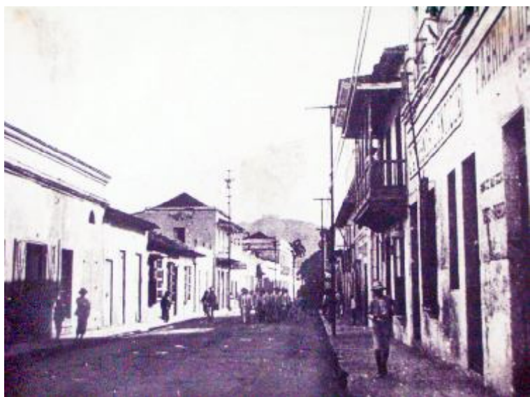
Calle Bolívar, principal arteria de la ciudad en las primeras décadas del siglo XX.

A partir de los resultados obtenidos en el Modelo de Gestión Integral en la rehabilitación del Centro Histórico de La Habana desarrollado por la Oficina del Historiador de la Ciudad (OH), se ha formulado el Proyecto de Intercambio y Apoyo Técnico para el Rescate y Fortalecimiento del Patrimonio Histórico de Puerto Cabello, Estado Carabobo, Venezuela, que contempla entre sus objetivos el Diseño e implementación de proyectos pilotos vinculado con la elaboración de un Diagnóstico General y del Plan Especial de Desarrollo Integral de su Centro Histórico.