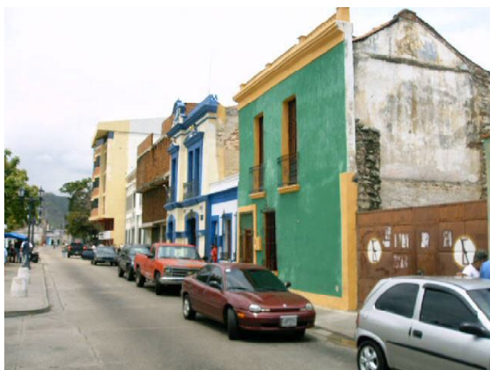
Modificaciones en fachadas donde se aprecia la sustitución de aleros por cornisas al estilo neoclásico. Inmuebles en calle Anzoátegui.