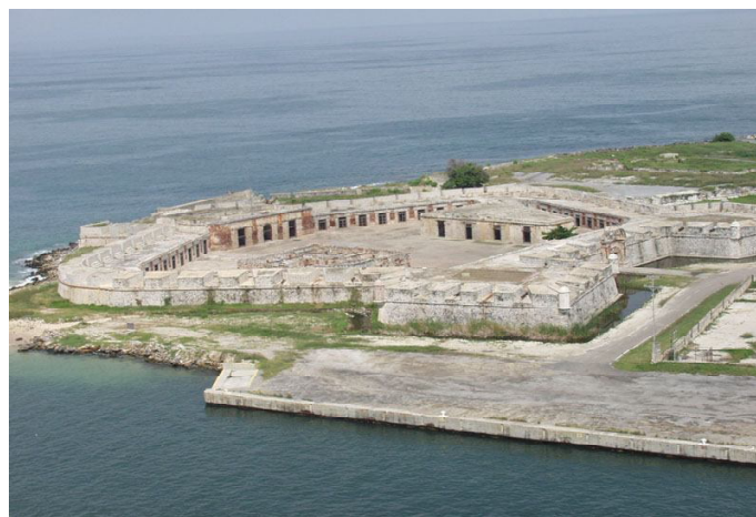
Fuerte de San Felipe de Puerto Cabello primera construcción militar de la ciudad. Terminada en el año 1733 fue el último bastión de la realeza en territorio venezolano. Vista aérea.

Por su vinculación con el entorno que nos concierne, se destacan las rutras culturales relacionadas con la colonización española en general y rutras relevantes en los procesos urbanos coloniales. "El Camino Real Intercontinental" como eje central de una red de la que forman parte distintos bienes culturales —ciudades históricas, paisajes culturales, etcétera.—, y en el que se destacan la "Caminería de la Costa Caribe": Nombre de Dios - Cartagena - Santa Marta - Maracaibo - Coro - La Guayra; dentro del "Camino Real En Nueva España", "Camino Real En Nueva Granada". El Fuerte de San Felipe de Puerto Cabello, como parte de la "Estructura defensiva de Nueva Granada, Sistema Defensivo Venezolano" destacando que: "...las fortalezas y todo el arte de la ingeniería militar muestran los diferentes niveles de desarrollo científico y tecnológico, así como las relaciones entre ciencia y economía, representando un universo científico que ayudó a cambiar el mundo". 10 "La Ruta Comercial del Cacao en Venezuela"; las "Rutras de difusión de la Revolución Industrial En Los países Iberoamericanos" y "Ciudades Históricas", otorgando un mayor papel a las ciudades periféricas menos conocidas —como es el caso de la ciudad de Puerto Cabello—; las rutras que abarcan las "obras e instalaciones públicas": Puertos internacionales y redes de abastecimiento e "Itinerarios vinculados a la minería histórica" sin restar importancia al estudio de las propuestas de "rutras culturales precolombinas ancestrales".