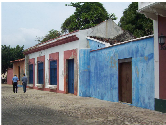
Modificaciones de fachada. Inmuebles en callejón de Uzlar, pertenecientes al conjunto de la Casa Guipuzcoana donde se ubicaban dependencias importantes para la vida de la ciudad.

En una caracterización preliminar del área de estudio, es posible señalar algunos aspectos importantes del entorno edificado de Puerto Cabello y de los antecedentes de la gestión de su Patrimonio.