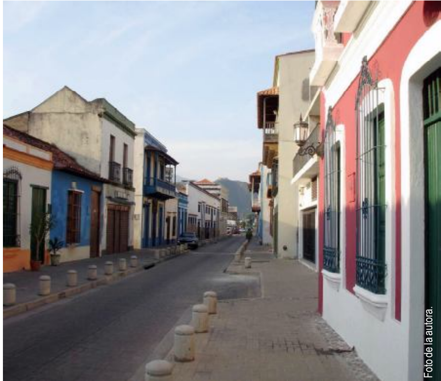
Calle Bolívar en el tramo del área fundacional.