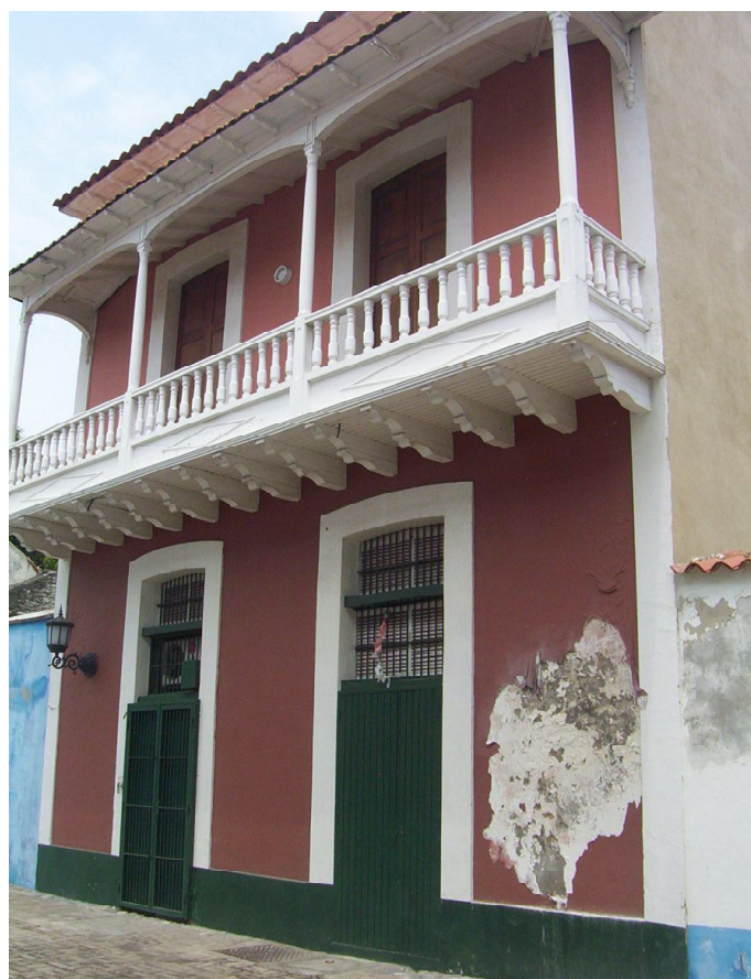
Tipica fachada con balcón. Tipología habitacional de la etapa colono.