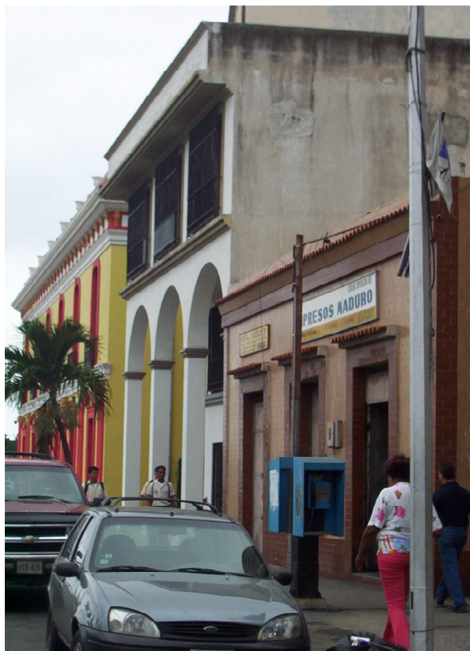
Entorno a teatro Municipal.