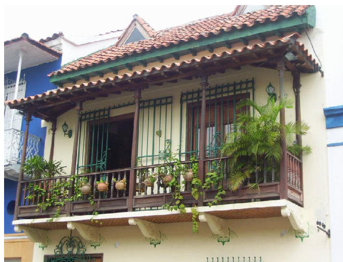
Margarita Ampliación Posada Santa Margarita.

4. Es conveniente realizar un estudio que abarque la recopilación y catalogación de toda la información de mapas y planos urbanos históricos de la ciudad . Se insiste en el tratamiento multidisciplinario que deberá darse a la investigación, más allá de la valoración historicista que habitualmente se da a estos temas lo que limita el conocimiento de la diversidad patrimonial que atesora el lugar. Debe