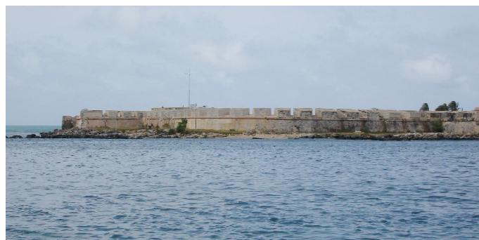
Fuerte de San Felipe de Puerto Cabello visto desde la ciudad.