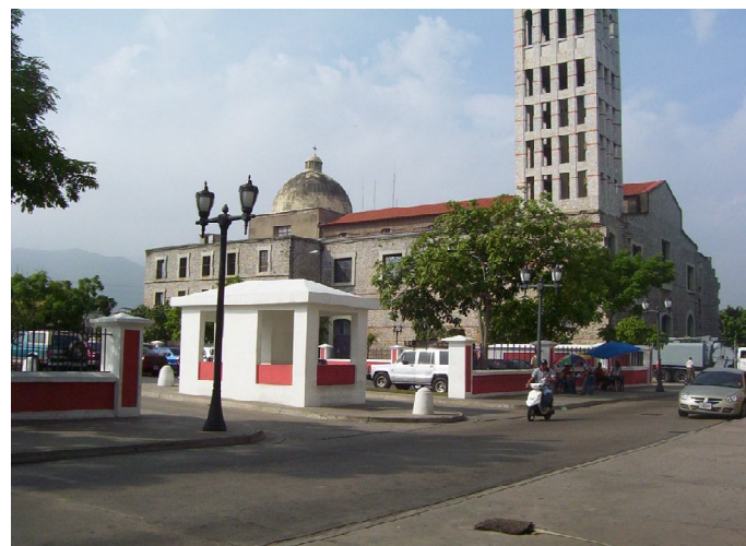
Las transformaciones que han sufrido muchos de los espacios y edificaciones del centro histórico de Puerto Cabello.