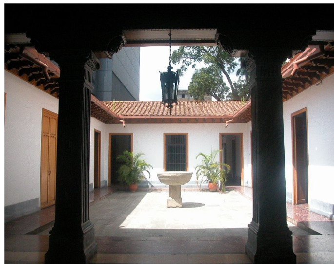
Patio interior. Casa de Simón Bolívar. Caracas.