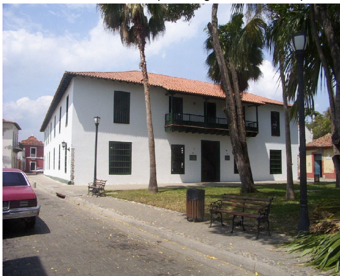
Casa Guipuzcoana. Inmueble más importante de la Zona Protegida de la ciudad de Puerto Cabello. Considerada la Casa Fundacional, es hoy Monumento Nacional.