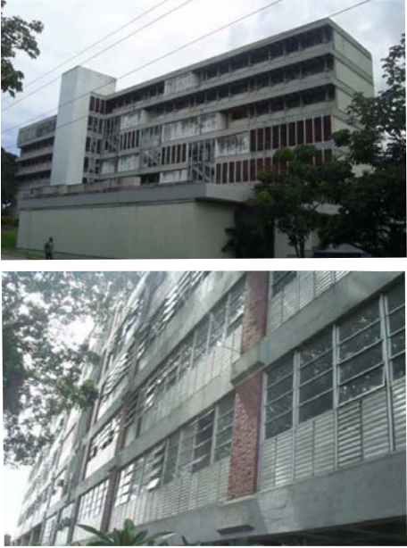
Figura 6: Actualización de las fichas del levantamiento del patrimonio material e inmaterial en la Cujae, en realización por el GPCC, para conformar el nuevo expediente de patrimonio cultural de la universidad, 2011.