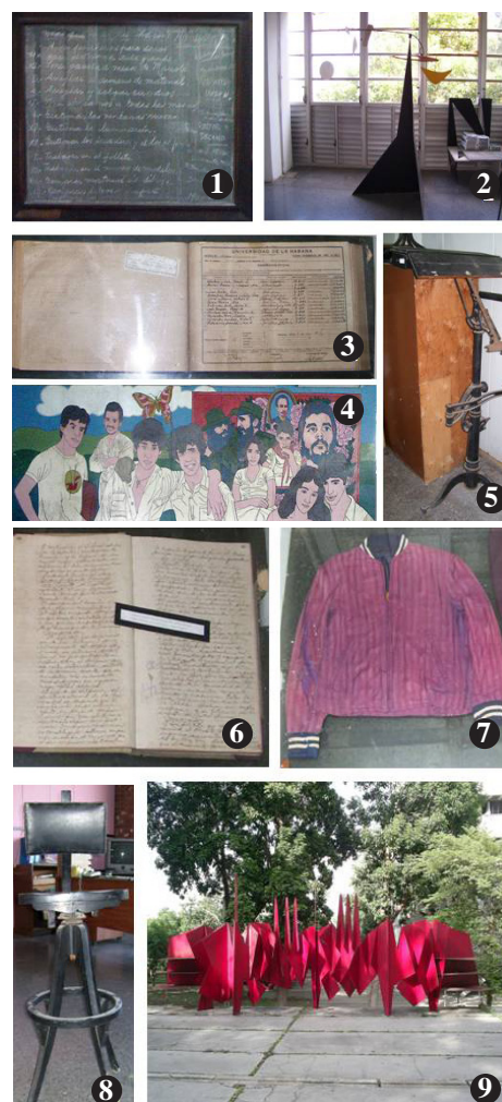
Figura 4: Nueve obras registradas en la Cujae.

El Plan de Reducción de Desastres para el Patrimonio Cultural del ISPJAE, es muy importante para la defensa del patrimonio existente pues permite que en caso de ocurrencia de algún evento natural o en tiempo de guerra, se cuente con un levantamiento preciso de cada pieza y sea posible su reconstrucción, si es que se pierde/destruye como consecuencia del mismo, así como se brindan todas las acciones necesarias para su protección (Ficha técnica, figura 6).