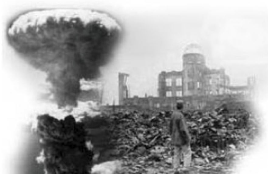
Figura 2. Ataque nuclear genocida, Hiroshima y Nagasaki, 6 y 9 agosto 1945.

La preparación militar con carácter curricular de los estudiantes universitarios se inició en septiembre de 1975, al firmarse el convenio entre el Ministerio de las Fuerzas Armadas (MINFAR) y el Ministerio de Educación (MINED), dando cumplimiento a uno de los acuerdos del Congreso Nacional de Educación y Cultura, para lo cual se creó el órgano de preparación militar en la Universidad de La Habana, que garantizó el cumplimiento del programa de preparación militar concebido para esta primera fase, surgiendo en el curso 1975-1976 las Cátedras Militares en los centros de educación superior del país. Se emitió el Decreto No. 24, de julio de 1978 y posteriormente, el reglamento para la preparación militar de dichas Instituciones, entre otros documentos rectores. [6]