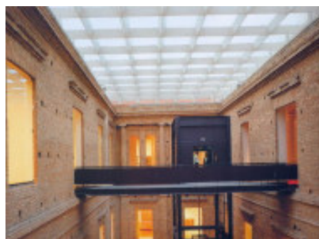
Remodelación del Edificio de Artesanos (siglo XIX) para Pinacoteca del estado de São Paulo. São Paulo, 1998. Arquitecto Paulo Mendes da Rocha. Arriba (derecha), vista del edificio en el contexto urbano, abajo, interior.

el hedonismo carioca, la Ciudad del Sexo propuesta por el estudiante Igor Vetyemy. Irracionales contradicciones políticas que se revierten negativamente sobre la calidad de vida de la población y que marginan los problemas reales de la ciudad.