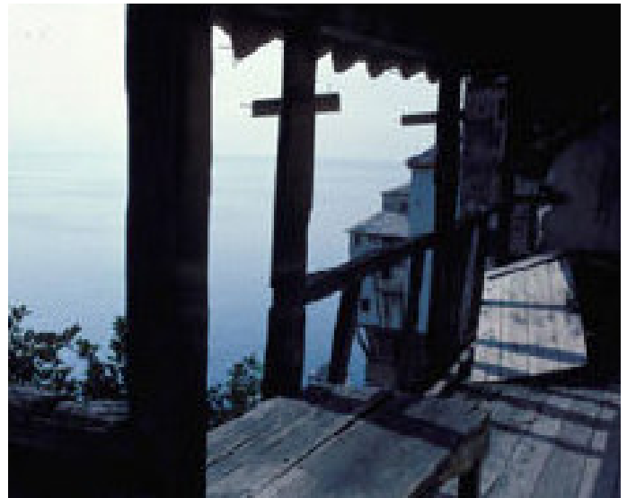
Monte Athos, Grecia.