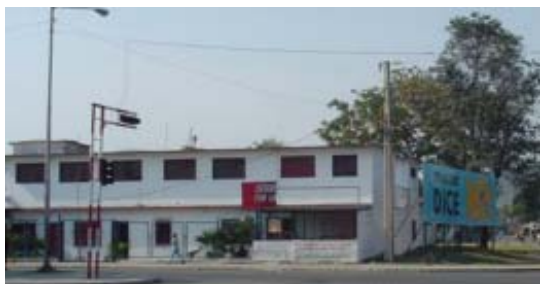
Edificio 2 a intervenir en la Avenida José Martí.