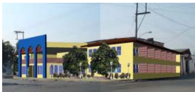
Variante 2 de la ubicación en la zona 1 de estudio de solución arquitectónica.

Con este trabajo se evidencia la importancia del uso de la computación en la intervención arquitectónica y urbana como herramienta para el diseño de soluciones permitiendo mayores volúmenes de informaciones en menor tiempo y en forma controlada, optimizando el tiempo con respecto a métodos y sistemas tradicionales.