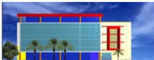
Variantes de estudio volumétrico y de fachada de la zona 2.

con lo cual se le otorga al dibujo la percepción de una atmósfera; la axonometría, como una nueva visión espacial, 2 la perspectiva urbana, como una manera de representar utopías, la fotografía, como el resultado de un proceso mecánico que captura un instante de la realidad con gran fidelidad donde se conjugan iluminación, color, forma; y recientemente los sistemas CAD 3 que comenzaron su desarrollo hacia 1960, convirtiéndose, en la actualidad, en el instrumento de mayor precisión para la representación arquitectónica.