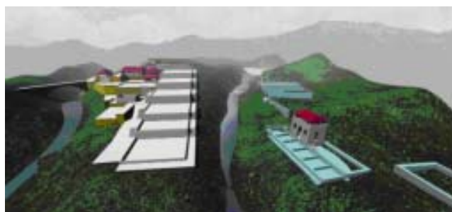
Reproducción de la imagen de secaderos de café, estructurado en terrazas para lograr la adaptación a la topografía. (Tomado de la tesis de Lourdez Rizo).