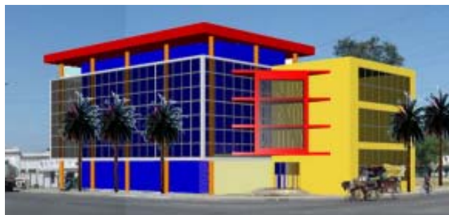
Variante 1 de la ubicación en la zona 2 de estudio de solución arquitectónica.