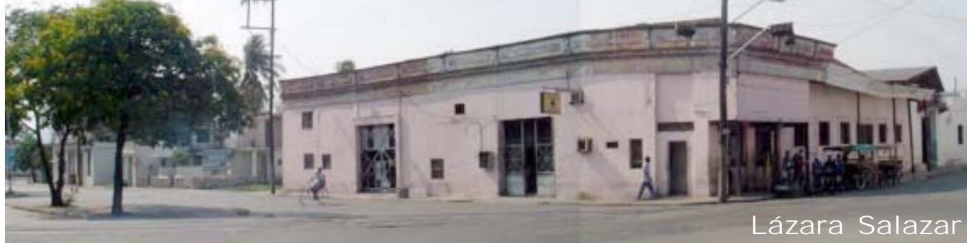
Edificio1 a intervenir en la Avenida José Martí.

La arquitectura, a través de todos los tiempos, se ha apoyado en la representación gráfica con el objetivo de exponer, de modo concreto, las ideas de las cuales surge una obra, así como todos los elementos precisos para su materialización. Para el arquitecto siempre va a ser necesario cierto conocimiento acerca de lo que puede ser o no geométricamente posible al emplear determinadas formas y materiales, y que de este estudio la obra adquiera una forma definida, ejecutable, y pueda ser llevada a la realidad a través de la construcción. Más que una simple herramienta de precisión, la representación arquitectónica y urbana con todos los aspectos que ella encierra, es un lenguaje que supera los elementos técnicos, para dotar de trascendencia artística y científica a la arquitectura. El presente artículo muestra la importancia de la utilización de las técnicas computacionales para las intervenciones arquitectónicas y urbanas como herramientas de diseño.