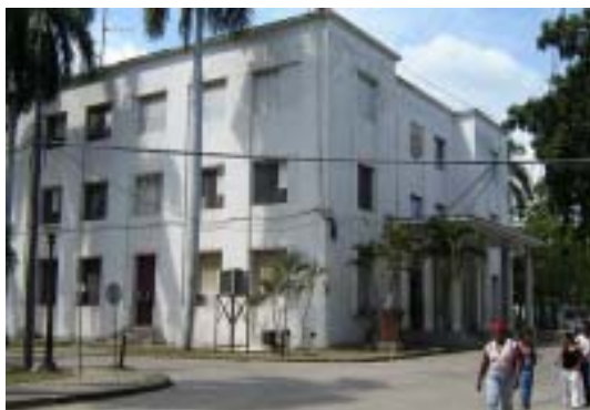
Antiguo edificio central, en el cual se evidencia la influencia del monumental moderno como una de las corrientes estilísticas de la época.