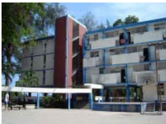
Influencia de los códigos de la vanguardia latinoamericana y del racionalismo en la residencia estudiantil de la Sede Central.