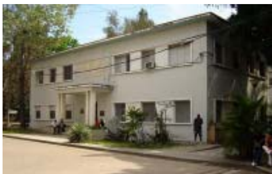
Biblioteca General de la Universidad de Oriente.