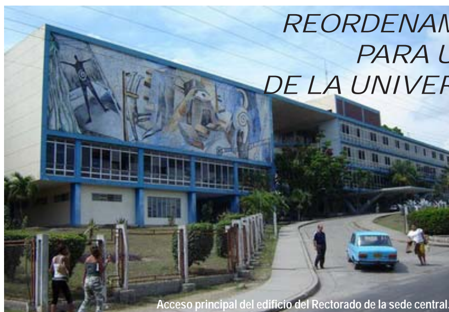
Acceso principal del edificio del Rectorado de la sede central.