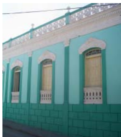
San Gerónimo No. 466 e/ Calvario y Carnicería.