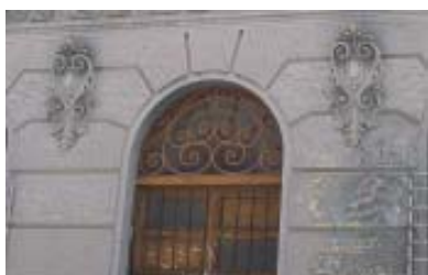
Reloj No. 307 e/ San Francisco y San Gerónimo.