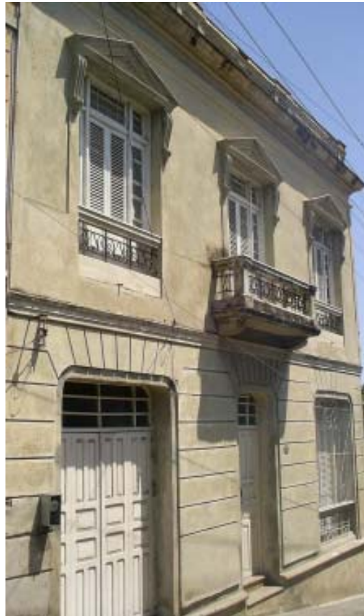
Vivienda correspondiente a la tercera etapa del eclecticismo en la ciudad de Santiago de Cuba. Santa Rita No. 475-477 e/ Reloj y Calvario.