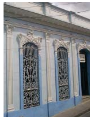
San Gerónimo No. 467 e/ Reloj y Calvario. Ejemplo considerado dentro de la variante del Ecléctico popular. Planta en L.