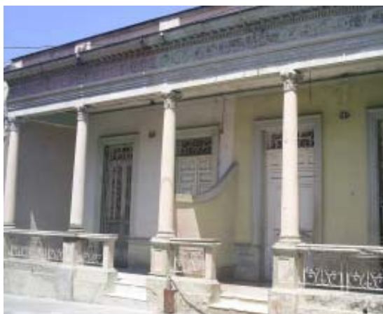
San Germán No. 525-527 e/ Calvario y Moncada.