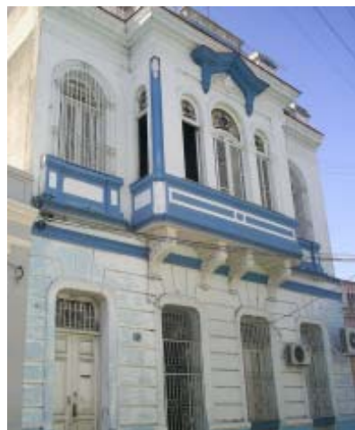
Bayamo No. 108 e/ Garzón y Paraíso.