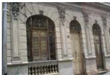
Santa Rita No. 475- 477 e/ Reloj y Calvario.