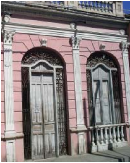
San Germán No. 511 e/ Moncada y Carnicería.