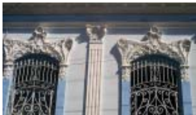
San Gerónimo No. 467 e/ Reloj y Calvario.