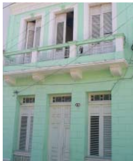
Fachada balconaje. San Gerónimo No. 478 e/ Calvario y Carnicería.

No existe gran variedad de tipos de pretil, se pudo comprobar la existencia de muro macizo con pilarotes y pilarotes con balaustradas, las cornisas predominan las escalonadas presentando en algunos casos modillones y denticulos. Los frisos que se encontraron fueron en su mayoría lisos y el arquitrabe al igual que la etapa anterior es un elemento definido por una moldura horizontal.