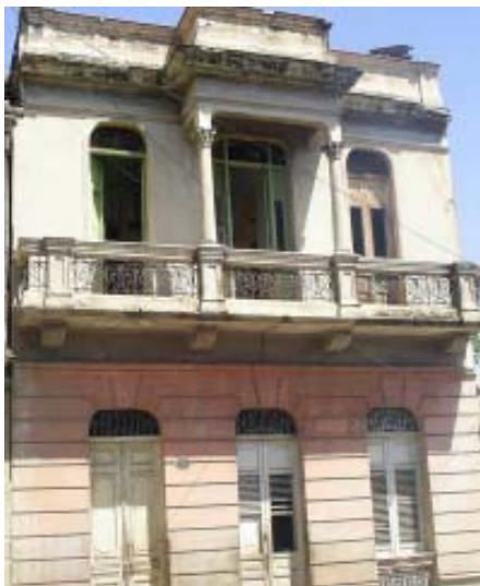
Carnicería No. 707 e/ Santa Lucía y Rey Pelayo.