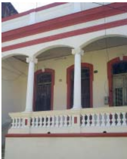
San Gerónimo No. 562 e/ San Agustín y Reloj.

El análisis tipológico que se presenta es el resultado del estudio de una muestra representativa de las viviendas eclécticas ubicadas en el Centro Histórico, en su selección se tuvo en cuenta los tipos de fachada y las variantes evolutivas ya definidas, existiendo un predominio del tipo de fachada simple en las tres etapas, la fachada de corredor apareció solo en la segunda etapa y la fachada de balconaje, aunque existen ejemplares en la primera etapa, alcanza un mayor desarrollo en la segunda y tercera. Esta muestra fue estudiada a partir de la desarticulación de cada tipo de fachada, tomándose como punto de partida para el análisis las partes y elementos componentes de la fachada simple quedando definidos como: forma de desarticulación de la fachada en sus partes componentes para el análisis tipológico, en tres grupos de elementos: