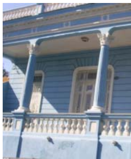
Fachada corredor. San Gerónimo No. 706 e/ Garzón y Paraíso.