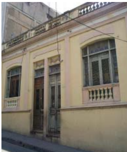
Heredia 364 No. e/ Reloj y Calvario.