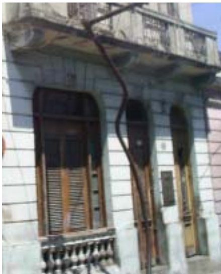
Calvario No. 416 e/ San Francisco y San Gerónimo.