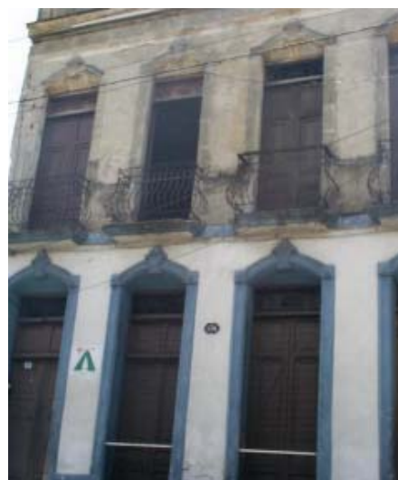
San Francisco No. 434 e/ Calvario y Carnicería.