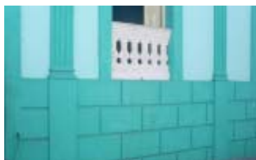
San Gerónimo No. 466.