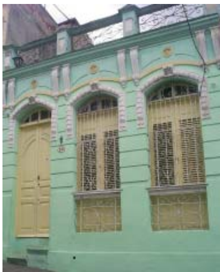
Bayamo No. 30 e/ San Agustín y Reloj.