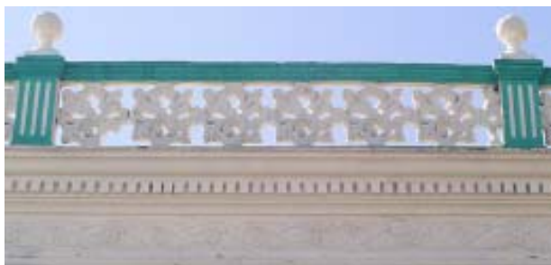
San Gerónimo No. 466 e/ Calvario y Carnicería.

decorados. Los balconajes presentan las mismas características descritas destacándose el hecho de presentar diferentes terminaciones en sus muros: superior e inferior.