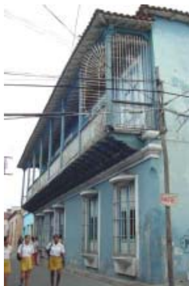
Vivienda de transición al neoclásico

La curva de valores predominantes en las primeras décadas toma valores próximos a 2, indicando que predominan los casos en que el ancho es el doble de la altura y ya en las últimas se acerca a 1,5, indicando que predominan los casos en que el ancho contiene una vez y media la dimensión de la altura.