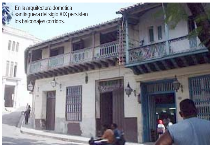
En la arquitectura doméstica santiaguera del siglo XIX persisten los balconajes corridos.