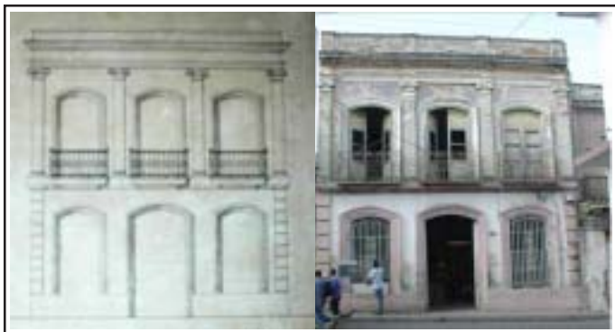
Ejemplo de correspondencia total.