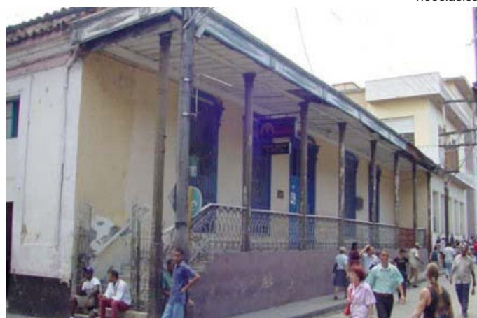
Vivienda de influencia neoclásica.