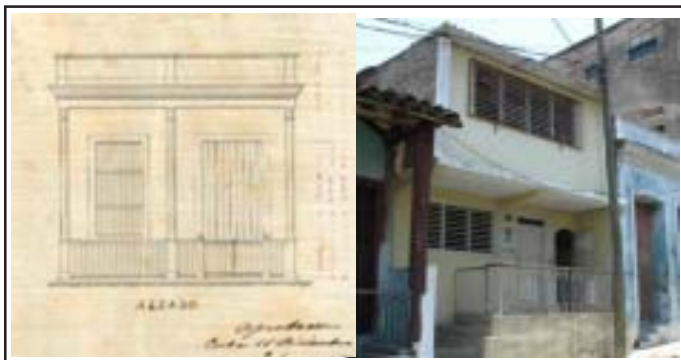
Ejemplo de correspondencia nula.

cuanto a tipo de fachada y cantidad de niveles y pequeñas en presencia de pie derecho y de simetría. Esto demuestra que han sufrido pocas transformaciones. Por lo cual puede deducirse que estos elementos no marcan significativamente las diferencias entre el proyecto y la realidad.