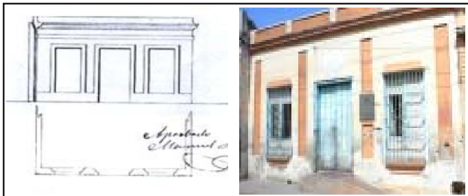
Ejemplo de correspondencia parcial (a).