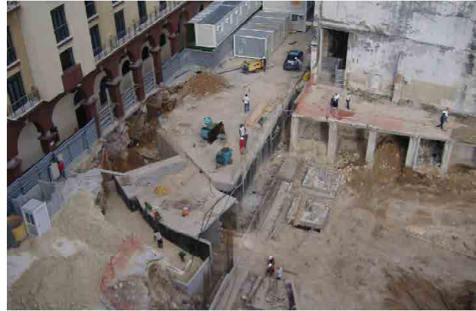
Obras inducidas que encarecen costos de edificación y aún más en rehabilitación. Foto Karen Sanabria, 2005.

Key words: estimating models, building rehabilitation costs, forecast prospective.