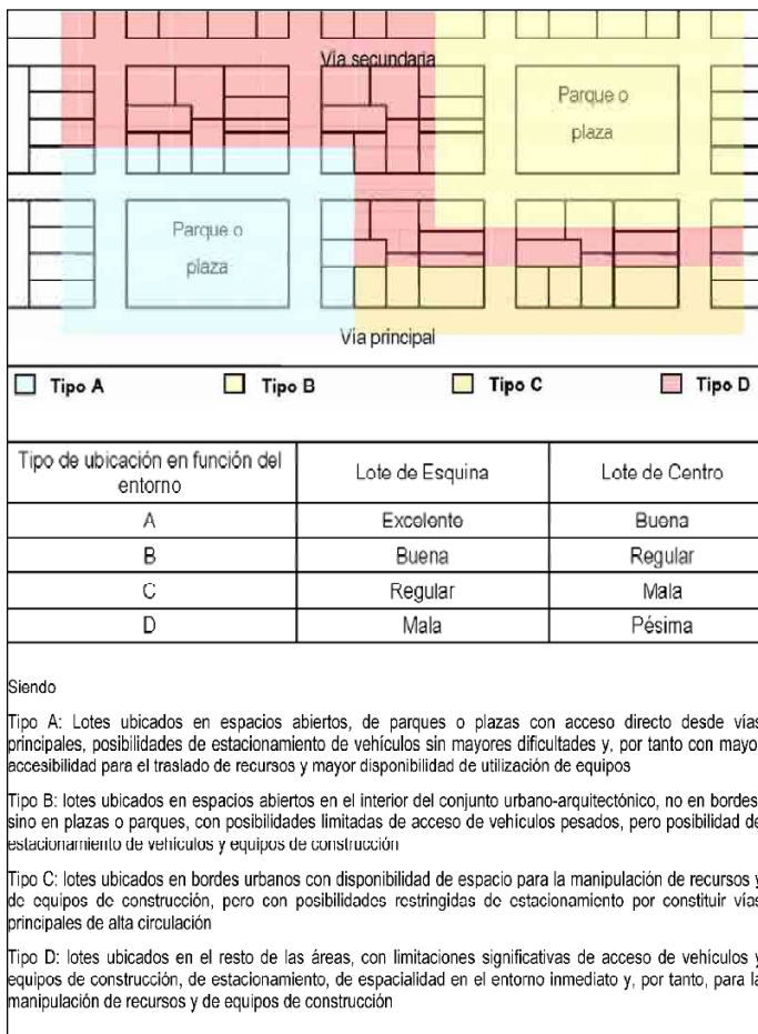
Figura 1. Ubicación general del lote, en función del entorno inmediato y de su localización en la manzana.

dependientes del resto, solo seis mostraban influencia directa en los CCM y debían ser incluidos en el modelo genérico contextualizado para el Centro Histórico de La Habana, como se muestra en la figura 3. Estos fueron: el costo unitario de construcción y montaje de referencia, el área total construida, los niveles de calidad deseados de servicios, tecnologías y acabados, la ubicación general del lote, el estado técnico-constructivo de las edificaciones existentes y las restricciones a las transformaciones expresadas por medio de los grados de protección.